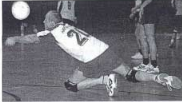
Integration durch Sport: Volleyball im Club Abseitz

Die Gruppe der Schwimmer ist die jüngste Abteilung - auch, weil es so lange gedauert hat, bis den Sportlern eine Trainingsbahn zur Verfügung gestellt wurde ist. Denn wer in Stuttgart Anspruch auf eine solche anmeldet, muss zunächst Mitglied in der Arbeitsgemeinschaft Schwimmsporttreibender Vereine (AGS) werden. Reine Formelle - sollte man meinen. Nicht so für den Club Abseitz, der ganze drei Jahre um die Aufnahme kämpfen musste. Die Vorurteile gegen die homosexuellen Sportler waren groß. „Auch die