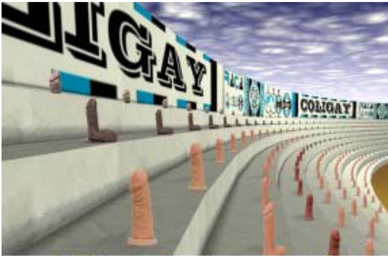
Seating is already prepared for Sydney's next parade.

“2002 Gay Games bietet Teilnehmern die einzigartige Chance, in einigen der besten Sport- und Kulturveranstaltungs-orte aufzutreten. Diese Erfahrung wird sich so schnell nicht wieder machen lassen.